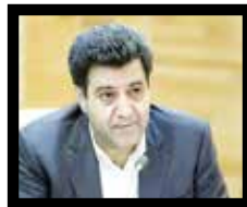
نایب رئیس اتاق ایران حسین سلاخوزی