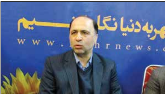
این دولت رای مجدد دارند.

آرام از اقدامات ویژه انجام شده در این دولت را بحث مشاوره ژنتیک برشمرد و افزود: در حال حاضر ۲۵ تا ۳۰ هزار کودک در کشور به علت بیماری‌های ژنتیکی با معلولیت متولد می‌شوند که آمار زیادی است و اگر اقدامی صورت نگیرد هرساله این تعداد به جامعه معلولین ما اضافه خواهد شد، به همین خاطر برنامه‌ای تدوین و در اختیار مجلس برای اتدوین برنامه ششم قرار داده شد و آن اجباری کردن غربالگری ژنتیک پیش از ازدواج بوده که با همراهی نمایندگان مجلس، به‌عنوان یکی از برنامه‌های اصلی در برنامه ششم مصوب شد.