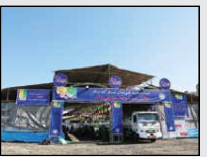
در آستانه عید سعید قربان؛

وی افزود : برای حفظ و آرامش شهر با جدیت عمل خواهیم کرد و در کنار سایر ارگان ها هر تدبیر لازمی را اتخاذ و اجرا می کنیم تا از وقوع مشکلات و معضلات شهری به واسطه ی این بی انضباطی ها جلوگیری کنیم.